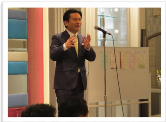
～佐賀県知事 山口 祥義 氏の祝辞～