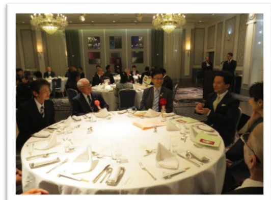
～円卓を挟んで語り合い～