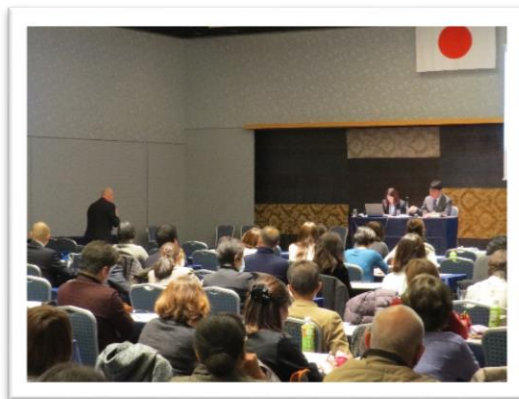
～行政説明と質疑応答の様子～