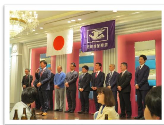
～青年部による挨拶～