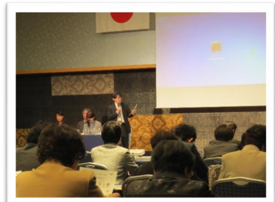
～子育てシェア・キッズライン・エニタイムズについて～