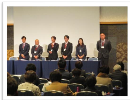
～佐賀県保育会 各活動報告～