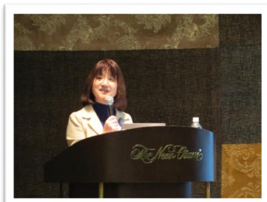
～磯部氏による災害を通して考える保育の本質と園の役割についての講演～